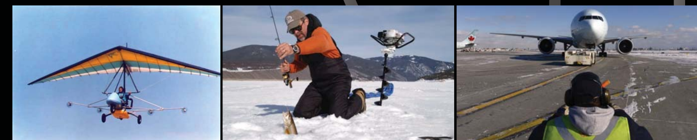
屋外での作業、釣りやスノーボードなどのアウトドアスポーツに。使い方は無限です！ * HeatCraftは、米国ボーイング社にOEM提供。地上屋外勤務員に支給されています。